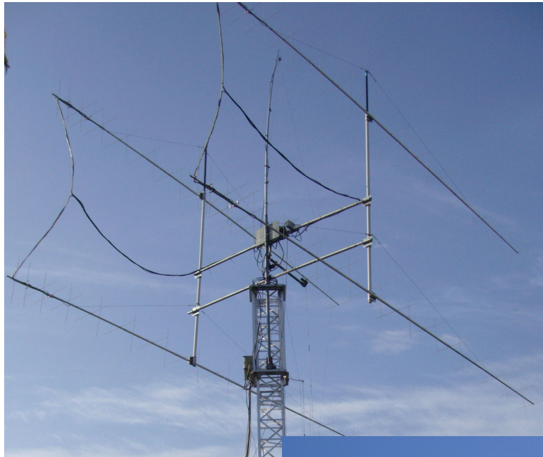
4 mal 144X28 bei DL9MS